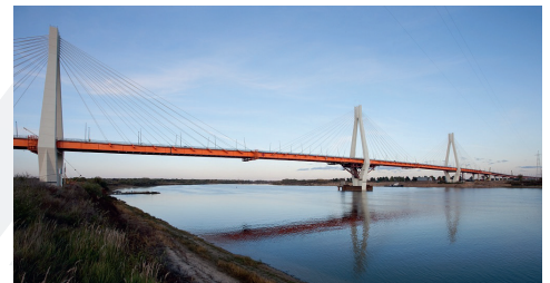
Мост через р. Оку в Муроме