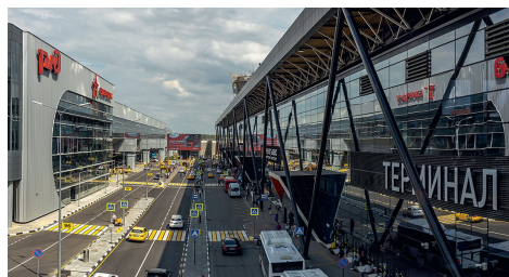
Вокзальный комплекс в Шереметьево