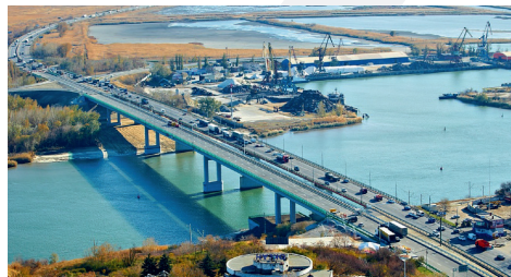
Мост через р. Дон в Аксае