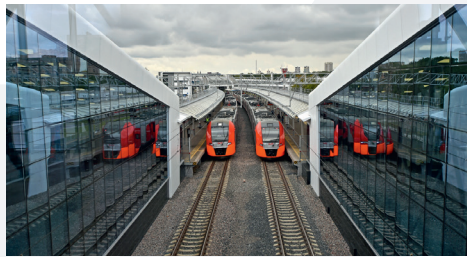
Развитие МЦК и МЦД