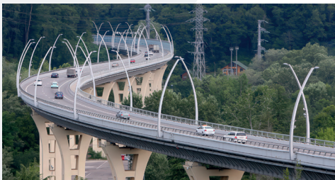
А-148 «Дублер Курортного проспекта»