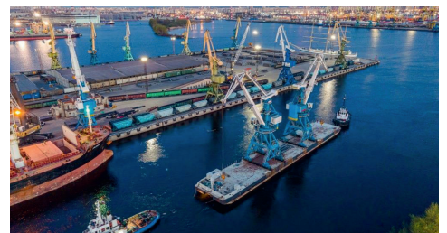
Ж/д узел у порта «Усть-Луга»